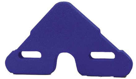
30659 Triangel Balancekick 550 x 330 x 42 mm