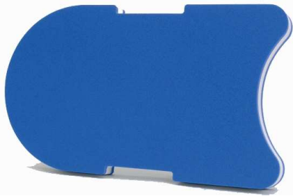
80583 Elbaka Senior 450 x 275 x 42 mm blau/weiss/blau