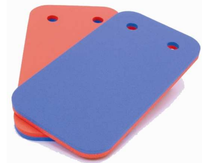
31003 Gen. Plus TWBS 460 x 245 x 25 mm, 2-Farbenkombination, 2 Löcher um Bretter aufzuhängen