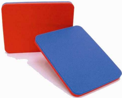
31000 Gen. Plus Starter Abm. 320 x 245 x 25 mm, 2-Farbenkombination